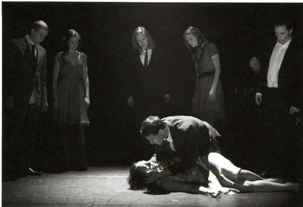
Innenschau , een voorstelling van Jakob Ahlbom uit 2010, Foto Stephan van Hesteren.

te puzzelen, zelf detective te zijn." ( TM/TiN , jg. 14, 2010, nr. 1)