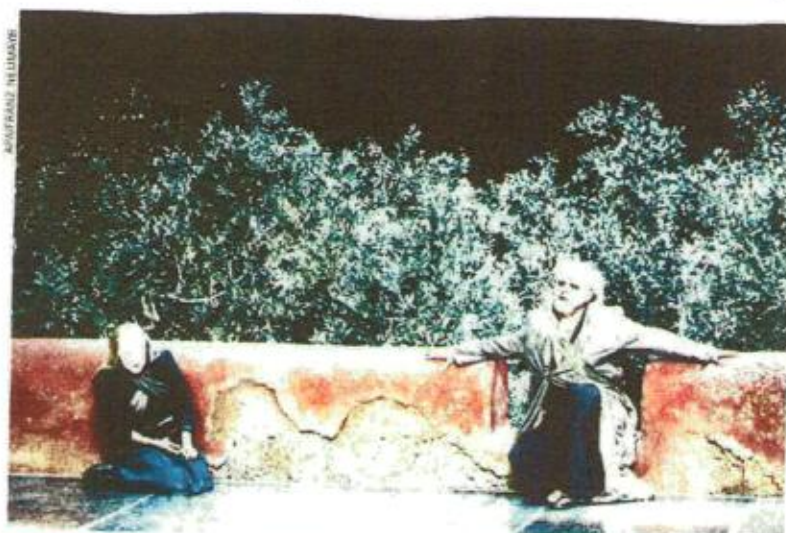
Sterbensstudie Klaus Maria Brandauer (re.) spielt „Ödipus auf Kolonos“