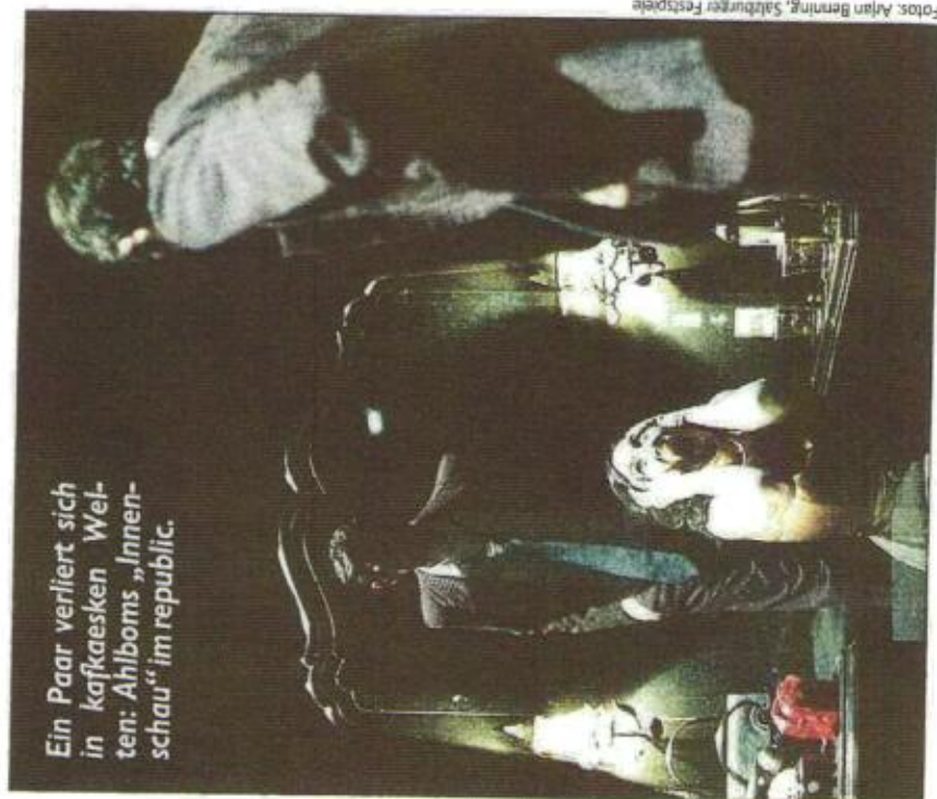
Ein Paar verliert sich in kafkaesken Welten: Ahlboms „Innenschau“ im republic.