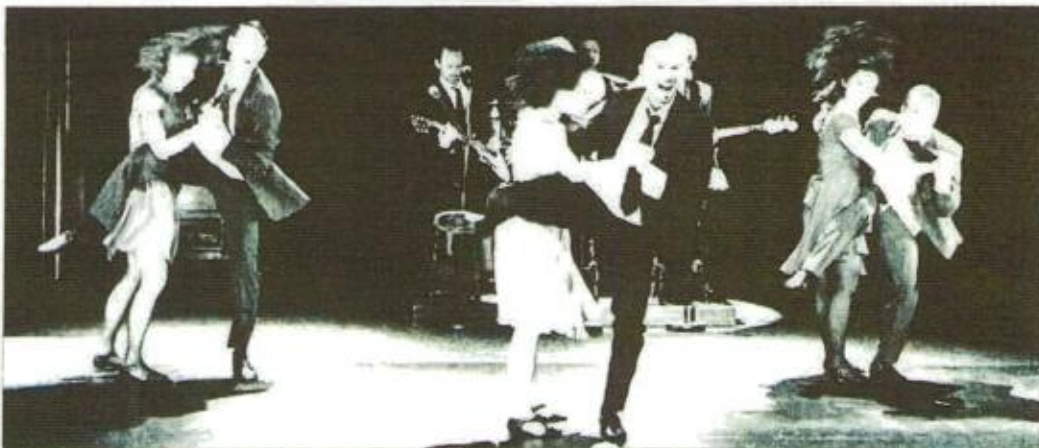
Viel Aktion, wenig Worte: Jakob Ahlboms „Innenschau“ unterhält durch hintergründige Perspektivenwechsel.