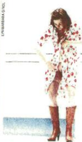
Szenen einer Ehe Elsie de Brat