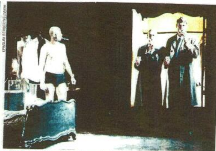
Unheimlich Ein Mann wird in „Innenschau“ mit Doppelgängern konfrontiert